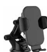
Wireless vehicle charger